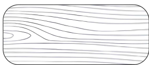
Garrafa - Lâmina e vidro