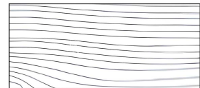
Reto/Retangular - Lâmina e vidro